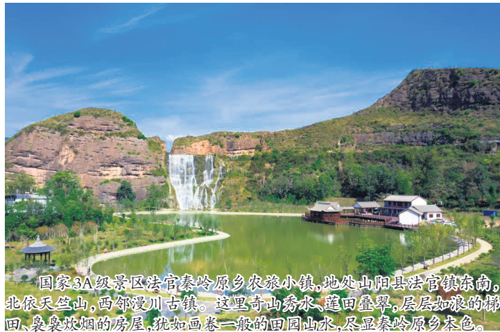
国家3A级景区法官秦岭原乡农旅小镇,地处山阳县法官镇东南,北依天竺山,西邻漫川古镇。这里青山秀水、庭园叠翠,层层如浪的梯田、袅袅炊烟的房屋,犹如画卷一般的田园山水,尽显秦岭原乡本色。