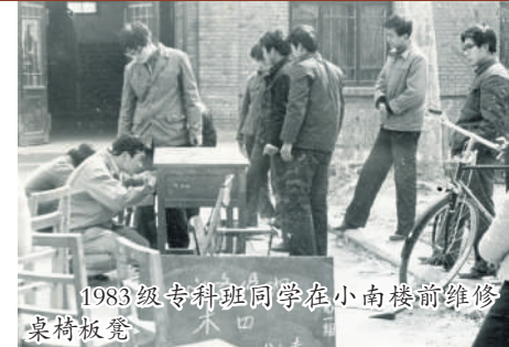
1983级专科班同学在小南楼前维修桌椅板凳