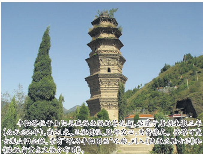
丰阳塔位于山阳县城西北隅的花萼山,始建于唐朝永徽三年(公元652年),高21米,呈楼阁式,腹部空心,为密檐式。登塔可览古城山阳全貌,素有“登高望平川”之称,列入《陕西省名胜古迹》和《陕西省重点文物保护单位》。