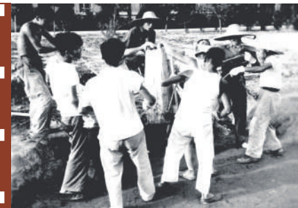
1959年夏,学生参加行政楼建设劳动

4. 加大先进典型宣传力度,营造尊重劳动、热爱劳动的校园风尚。先进典型具有榜样引领、提振精神、激发动力的作用。新时代条件下,要充分利用各类媒体大力宣传校内外为社会作出突出贡献的劳动模范和其他典型的先进事迹,广泛宣传和弘扬劳模精神、劳动精神。通过校园模范教师、模范卫士、模范志愿者等荣誉称号的评选表彰,引导广大师生树立辛勤劳动、诚实劳动、创造性劳动的理念,在校园营造尊重劳动、热爱劳动、尊重人才、尊重创造的良好风尚。(李政敏 赵庆菊)