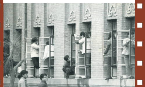
理论系1982级哲学班同学学雷锋义务劳动

二是融入大思政格局。劳动教育的核心目标是培育和践行劳动价值观。全员、全方位、全过程育人目标和任务必然要求将劳动教育积极融入大思政格局之中。建立健全劳动教育学科体系、教学体系、教材体系和管理体系,开好劳动教育课程,与思想政治理论课同向同行,使德育和劳育形成协同效应。通过增加教育教学实践课时,鼓励参加创新创业项目、社会志愿服务、勤工俭学、专业实践、毕业见习和产教融合等多种途径,强化社会实践育人,培养大学生尊重劳动、热爱劳动和珍惜劳动成果的真情实感。