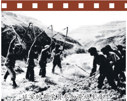
延安时期学员参加劳动生产