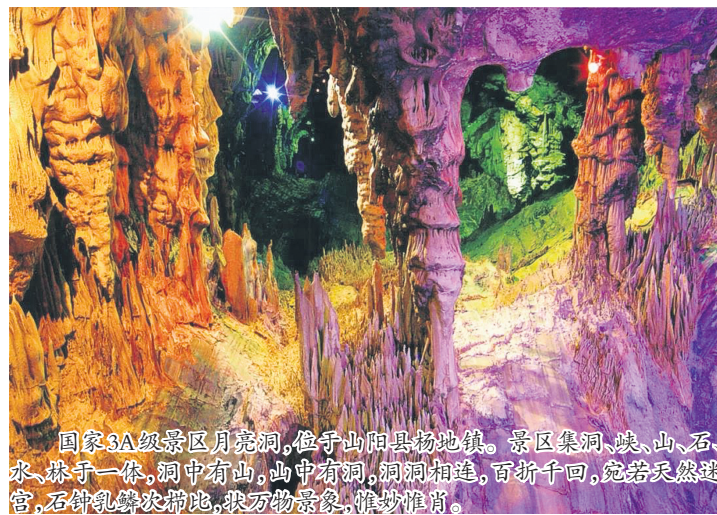
国家3A级景区月亮洞,位于山阳县杨地镇。景区集洞、峡、山、石、水、林于一体,洞中有山,山中有洞,洞洞相连,百折千回,宛若天然迷宫,石钟乳琳琅满目,获万物活态,惟妙惟肖。