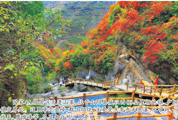
国家4A级景区天蓬山寨,位于山阳县城以西80公里物地镇、卢镇交界处。这里峰峦叠嶂,群山环绕,主要景点有九天悬瀑、水帘洞、一线天、鹰嘴峰等,尽显大自然之鬼斧神工。