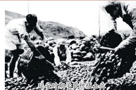
延安时期学员种粮食