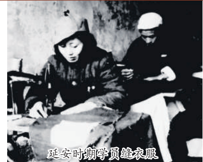
延安时期学员缝衣服