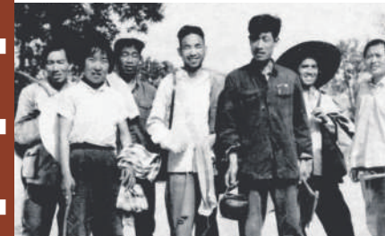
1967年,部分教工在陕西省大荔县帮助收麦