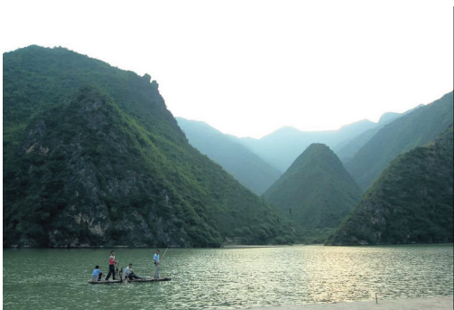
▲国家3A级景区小河口,位于漫川古镇小河口村。景区依托小河口村独特的陕南原始地貌和宽衍的金钱河水域,集自然风光、人文风光和田园风光为一体,是陕鄂旅游大轴线上的一颗璀璨明珠。