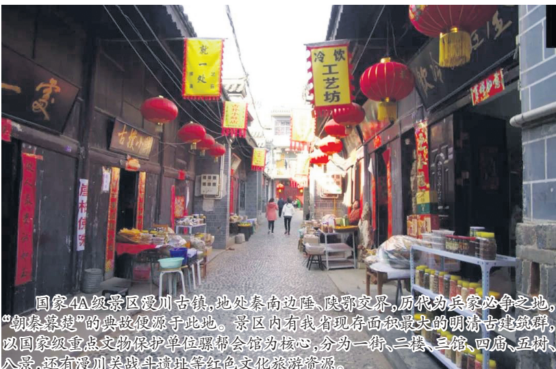
国家4A级景区漫川古镇,地处秦南边陲、陕鄂交界,历代为兵家必争之地,“朝秦暮楚”的典故便源于此地。景区内有着现存面积最大的明清古建筑群,以国家级重点文物保护单位驢蹄会馆为核心,分为一街、三楼、三馆、四庙、五村、八景,还有漫川关战斗遗址等红色文化旅游资源。