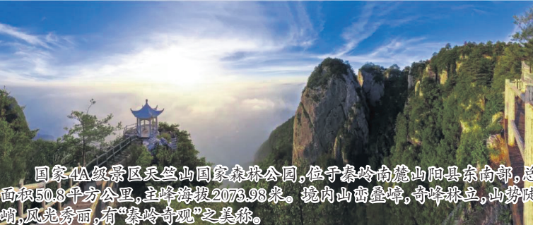
国家4A级景区天竺山国家森林公园,位于秦岭南麓山阳县东南部,总面积50.8平方公里,主峰海拔2073.98米。境内山峦叠嶂,奇峰林立,山势陡峭,风光秀丽,有“秦岭奇观”之美称。