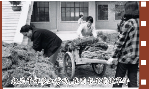
机关干部参加劳动,在图书馆前植草坪

尽快修订《教育法》和《高等教育法》,将劳动教育、“劳育”入法,规定劳动教育主体的责任,界定劳动教育的权利,从顶层设计上建构完备的人才培养体系要求,为高校开展劳动教育提供法律依据与支撑。建立劳动教育考评结果的全方位使用激励机制。教育行政部门和相关机构要将对个人劳动教育考评的结果充分运用到升学就业、参军入伍、资助评定、党员发展等重要环节中,使其作为德才鉴定的重要组成部分。