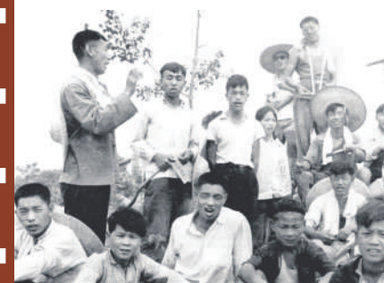
1965年6月,学生在陕西省户县天桥乡夏收时唱歌