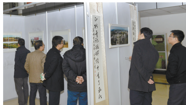
主题为“创业开启新篇章 嬗变成就再辉煌”的70幅反映长安新校区十年建设发展过程的纪实图片,近日在长安校区展出。校党委宣传部专职摄影师杜超英用手中的相机记录了学校十年发展过程。以图片的形式回顾历史,直观且感同身受,会让我们更有信心的展望未来,为实现法治中国梦而奋斗。