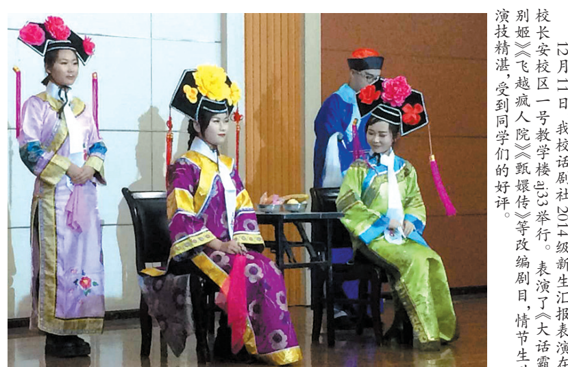
12月2日,我校话剧社2014级新生汇报表演在长安校区一号教学楼总台举行。表演了《大话霸王别姬》《飞越疯人院》《甄嬛传》等改编剧目,情节生动,演技精湛受到同学们的好评。