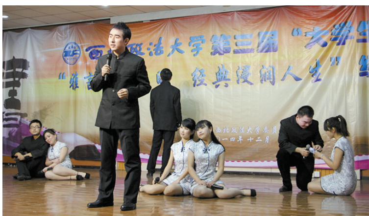
12月5日,第三届“大学生读书节”暨“雅言传承文明,经典浸润人生”经典诵读大赛在我校长安校区一号教学楼AJ33教室举行。比赛中,来自我校十一个学院的参赛者以饱含深情的朗诵配合富有创意的表演,多次博得现场同学们的掌声。冠军最终由新闻传播学院获得。