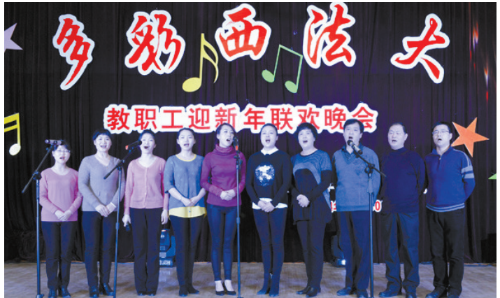
12月30日晚,由校工会、党委宣传部、校团委共同举办的“多彩西法大”教职工迎新年联欢晚会在雁塔校区教职工俱乐部华丽上演。晚会节目流行与古典兼收,温情与火热并举,形式多样,精彩纷呈,充分体现了学校教师青春激扬、奋发拼搏、憧憬未来的精神风貌。