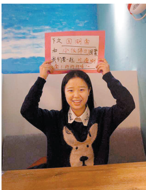
“天南海北,总在一起。” ——李菲卿