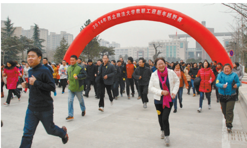
12月26日下午,由校工会主办,民高法学院分会承办的“西北政法大学教职工迎新年越野赛”在长安校区举行,全校500多名教职工参加了比赛。比赛中,参赛教职工斗志昂扬,全力拼搏,互相鼓励,现场气氛热烈。