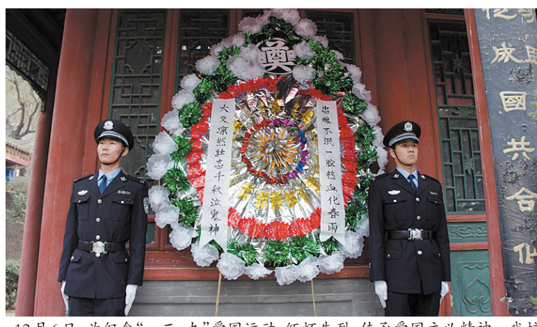
12月6日,为纪念“一二·九”爱国运动,缅怀先烈,传承爱国主义精神。我校公安学院组织2014级全体同学前往杨虎城烈士陵园进行参观扫墓活动。扫墓活动中,由国旗护卫队向烈士敬献花圈,全体同学脱帽默哀并致敬。本次活动在同学们的宣誓声中结束。