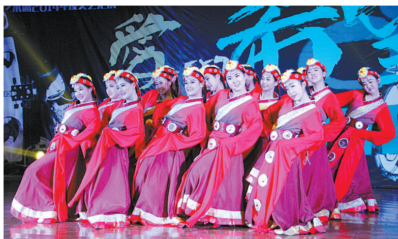
12月7日,我校大学生艺术团“爱与希望 现场live”2014年度文艺汇演在长安校区一号教学楼AJ33教室举行。艺术团团员先后向同学们呈现了舞蹈、器乐、歌曲、小品等表演,在展现政法学子青春活力的同时,丰富了我校同学们的课余生活。