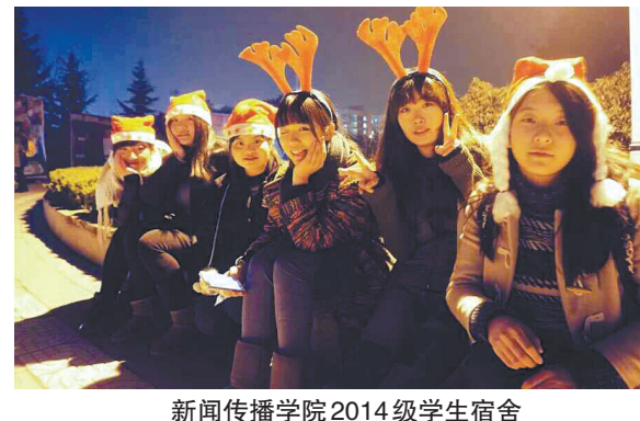
新闻传播学院2014级学生宿舍

2014年9月我们迎来了期待已久的大学生活。一起走过的120天,如今回忆起来是多彩亦是黯然。Hey guys,你还记得过去那一幕幕精彩的瞬间吗?2014年我们一起聆听音乐,一起畅想未来。现在我们将鼓起勇气,用双手共同开创未来。2015年,我们来了!