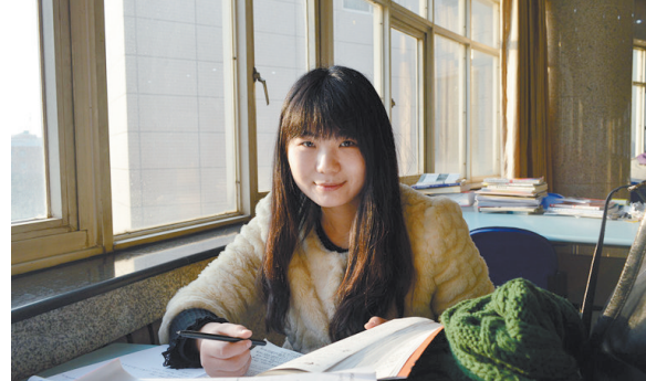
图书馆复习的2012级同学

我的工作就是给同学们收拾好餐盘,为同学们提供一个良好的就餐环境。回顾2014年,在工作之余和同学们坐在一起吃饭、沟通,感受同学们的青春气息,十分快乐。2015将至,还是要求自己干好本职工作,尽职尽责无愧于心。也希望同学们可以珍惜粮食,杜绝浪费。