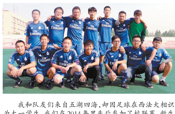
政治管理学院2014级足球队

2014年是我来到大学的第二年,我在这一年中找到自己想要为之努力的目标,也更加确定了自己要成为一个什么样的人。至于2015年,我想借用张皓宸说过的话:愿生活可以如诗般自由,愿吃饭的饭,见想见的人,看喜欢的风景,做自己喜欢的事,愿心不老,有人一起胡闹,你还在,我依然,简直不能更爽。