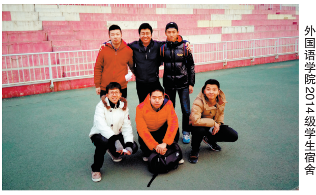
外国语学院2012级学生宿舍

看着学生们在努力看书做题准备考研,我记起了自己孩子考研时的背影。过去的一年感慨万分,看到孩子在辛勤付出之后终于得到回报,十分的欣慰。明年在做好自己工作之外,还要向考研学生传授经验,排解学生的心理压力,愿每个考生都可以实现自己的目标。