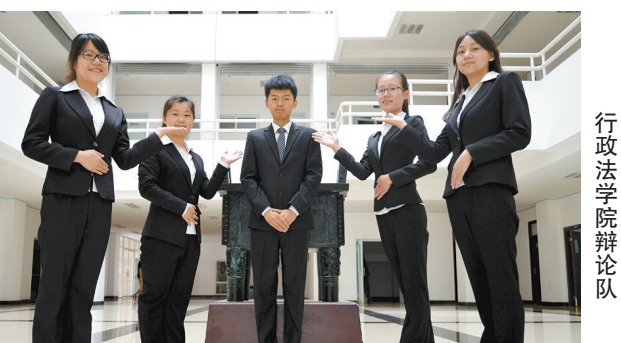
行政法学院辩论队

最忘不了的还是高考,那段由咖啡、考试构成的日子,现在回想起来,真是佩服自己的认真努力。2014年是收获的一年,也是遗憾的一年,告别了亲人与家乡,迎来十八岁,来到西安读书,感谢离别的同时更感谢相遇。在2015年里,希望自己成为更好的人,充满热情,热爱生活,愿岁月可回头亦无遗憾。你好,2015,我在路上。