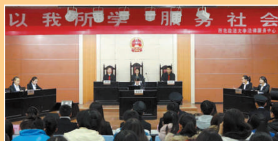
由法律服务中心主办的模拟审判法庭在长安校区一号教学楼AJ33教室举行。本次模拟法庭围绕一起故意伤害案件展开,同学们以严谨客观的态度生动模拟了此次案件,将理论灵活运用与实践当中,充分展示了学子的风采。

十一月,校内学生活动精彩不断。五彩缤纷的校园活动丰富了学生的课余时间,为学生提供了展示自我能力与发挥创造力的舞台,也彰显了我校校园文化的勃勃生机。