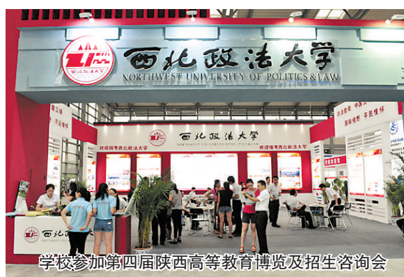
学校参加第四届陕西高等教育博览及招生咨询会