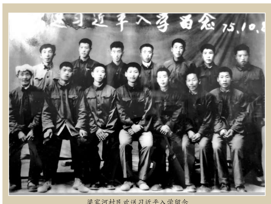
梁家河村民欢送习近平入学留念

2015年9月,习近平总书记在美国西雅图讲述了梁家河的故事,总书记说:“上世纪60年代末,我才十几岁,就从北京到中国陕西省延安市一个叫梁家河的小村庄插队当农民,在那儿度过了7年时光。”习近平总书记与外国友人分享了他插队的经历,并就春节期间他回到梁家河看到乡亲们生活发生的巨大变化告诉大家:“梁家河这个小村庄的变化,是改革开放以来中国社会发展的一个缩影”。习近平总书记以自己的亲身经历来讲述中国社会的发展变迁,告诉世界:满足中国人民对美好生活的向往,就是实现中国梦。习近平总书记的演讲由此引起世界对梁家河的关注,很多外国政