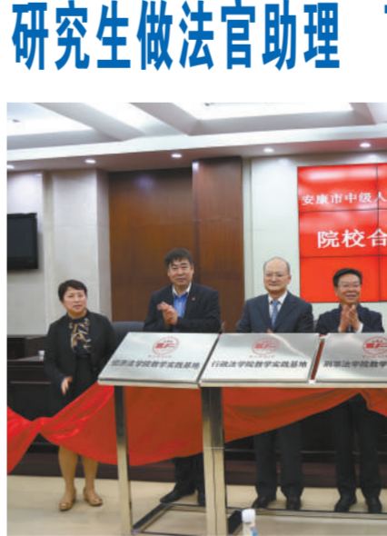
校与社会之间的壁垒,促进理论和实践相结合的务实举措,对于提升全市法院审判理论水平、加强审判专家库建设、建设高素质法官队伍具有重要意义。“安康市中级人民法院应主动加强与通联联系,全力搞好协调服务,不断完善理论研讨、疑难案件论证、双向人才培养和学术研究机制”,他希望通过实现院校共建,携手为中国特色社会主义法治建设进程作出积极贡献。强力表示,习近平主席视察中国政法大学不仅体现了党中央、国务院对高等教育尤其是法学教育的重视,更释放出建设法治社会的信心和勇

气。西北政法大学和安康市中级人民法院作为法律共同体,携手共同打造教学实践基地,旨在通过一系列务实合作开展全方位的多元互动,将解决实际问题上升到理论高度,通过宣传培训、开展讲座、加深研讨等方式进行最贴近学术和业界前沿的经验感悟交流。