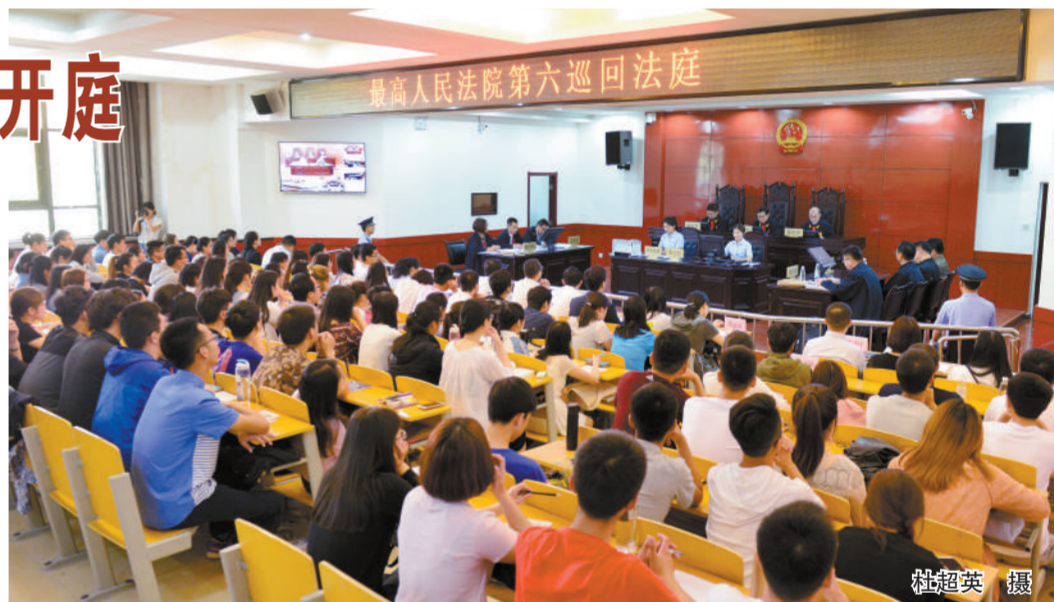
参与办理具体案件、接待来访申诉、记录庭审案件、起草法律文书以及专题调研工作。第六巡回法庭还将与高校搭建共同进行案例教学、司法大数据分析、专题研讨、讲座培训的平台,进一步完善挂职锻炼、教学实习等制度,积极推动法学科研与司法实践有效对接。此次巡回法庭进校园就是双方根据庭校合作协议,将司法部门的优质实践教学资源送入高校,共同肩负起培养德法兼修的卓越社会主义法治人才队伍的重要尝试。(教务处)

院审理案件,还是在校园里旁听,机会非常难得,对第六巡回法庭庭审法官精准的庭审把控能力、谦和的审判态度、严密的思维逻辑留下了深刻印象,实实在在地上了一堂生动、规范的审判实务公开课。为贯彻落实习近平总书记5月3日在中国政法大学考察时的重要讲话精神,促进法学教育与司法实践相结合,深化司法公开,第六巡回法庭已于5月11日召开了西北地区部分法律院校座谈会,与我校、西安交通大学、兰州大学等7所高校签订了合作协议,就完善六巡与法学院校双向交流合作机制,共同为“一带一路”建设提供优质司法服务和保障。为落实《最高人民法院第六巡回法庭和西北政法大学合作协议》中关于接收西北政法大学研究生为第六巡回法庭法律实习生的规定,经西北政法大学各学院推荐和第六巡回法庭遴选,法学理论、刑法学、民法学、经济法、宪法学与行政法学、新闻学等6个学科专业的17名硕士研究生成为最高人民法院第六巡回法庭首批法律实习生。在导师帮助下,法律实习生将直接